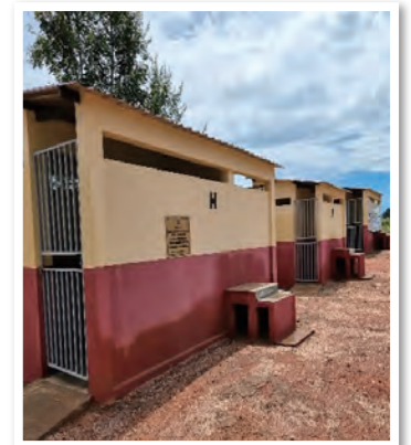
学校に新たに設置された男女別のトイレ

手押しポンプを備えた 手洗い場を19校に設置 し、 10,821人の児童 と地域住民5,700人が安全な水を使用できるようになりました。また、 男女別のトイレを15校に設置 し、 14,997人の児童 が利用しています。さらに、15校の264人の児童クラブのメンバーを対象に研修を行い、クラブ活動を通じて子どもたちは、爪や髪などの身だしなみ、歯磨き、生理、衛生習慣、新型コロナウイルスの感染症対策などを学びました。また、手洗い場を新たに設置する30校で、教員や地域住民などから構成される水委員会を設立し、地域住民からの水の使用料の徴収や財務管理、メンテナンス、修理など、手洗い場が持続可能な方法で維持できるように研修が行われ、228人が参加しました。