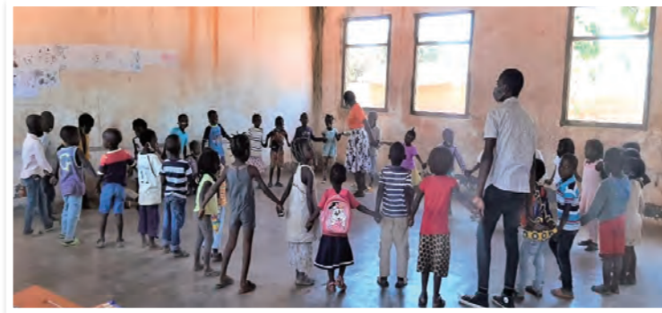
プログラムに参加する子どもたち

ユニセフは、モザンビーク教育省とともに、小学校入学前の5歳～6歳の子どもが就学前教育を受け、小学校で学ぶ準備ができるように、「短期集中就学準備(ASR)プログラム」を推進しています。日本の皆さまのご協力により、ナンブラ州の 2,460人の子ども (障がいのある子ども37人を含む)が同プログラムに参加することができました。