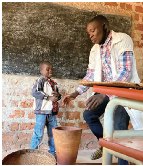
小学1年生の遊びを取り入れた授業

子どもたちは、 120時間(8週間、週5日、1日あたり3時間) をかけて、数の数え方や公用語のポルトガル語での読み聞かせなどを通じて、基礎的な算数と言語スキルを身につけ、グループ活動を通じて、社会性を育むことができました。プログラム修了後は、参加者全員が小学校に入学することができ、ナンブラ州の初等教育の就学率55.1%を大きく超える結果となり、プログラムが小学校入学の大きな後押しとなっていることが証明されました。